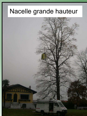
Nacelle grande hauteur

Aujourd'hui, les 4 salariés et lui-même sont habilités « Haute Tension-Basse Tension » par EDF pour l'élagage