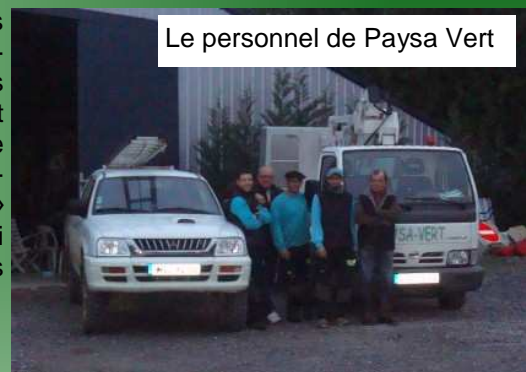
Le personnel de Paysa Vert

d'arbres dangereux proches des lignes électriques, mais aussi par l'Équipement (ex-DDE) lors de dégagement des voies de circulation et cela dans tout le 64 et le sud des Landes.